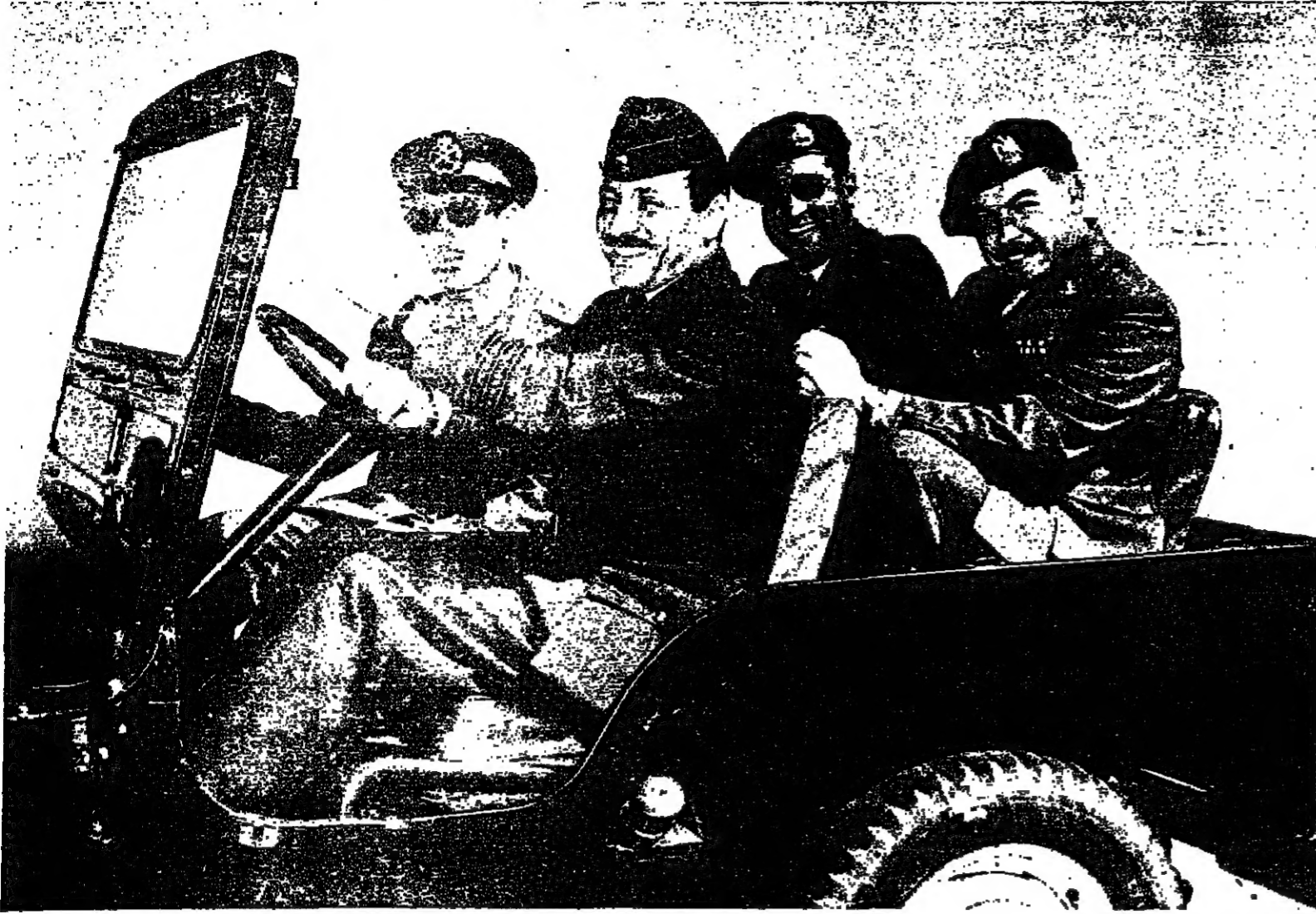
عبد اللطيف البغدادي يقود سيارة «جيب» وبجانبه عبد الحكيم عامر وخلفه حسين الشافعي